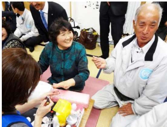
奥様の施術の様子を旦那様も見られていました