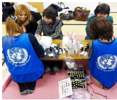
施術中も笑い声が溢れていました