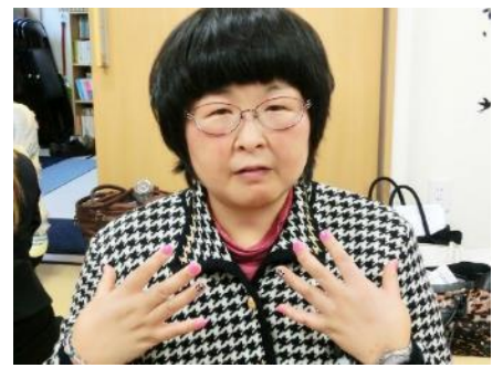
ネイルを楽しみに参加