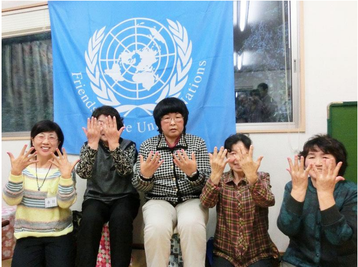
今もなお不自由な仮設住宅にお住まいの皆様はネイル施術後、とても良い表情をされていました