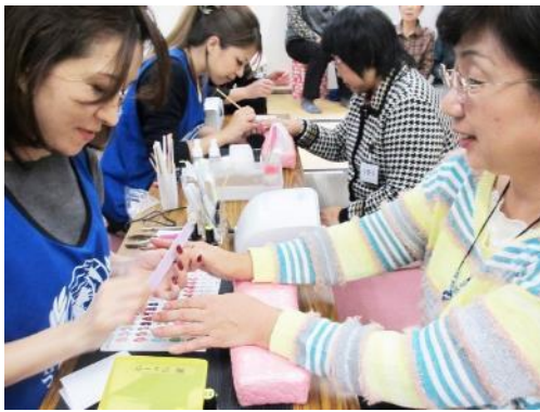
施術会場には仮設住宅で暮らす多くの方々がいらっしゃいました