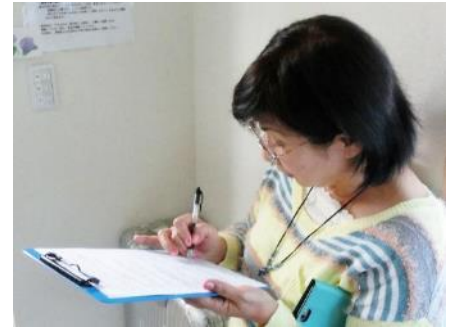
ジェルネイルの施術を受けてもらった皆様にはアンケート調査にご協力を頂きました

ネイル施術を受けることは贅沢ではなく、 『人が人として、文化的な営みを楽しむ行為』として一人でも 多くの女性に参加頂ける活動にしていきたいと思っております。