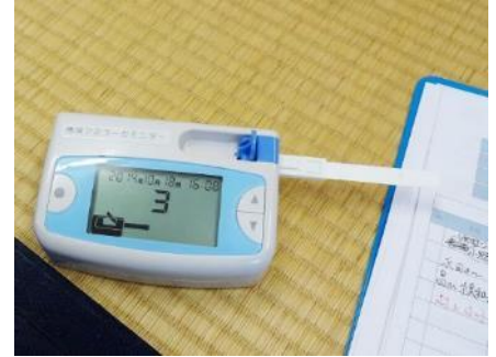
被験者は施術後に大幅な数値減少が確認